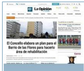
Megabanner flotante 990x90