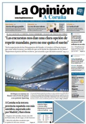
Módulo portada 2x2