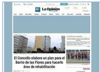
Billboard + Laterales