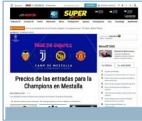
Megabanner flotante 990x90