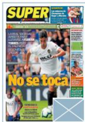
Módulo portada 2x2