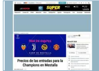
Billboard + Laterales