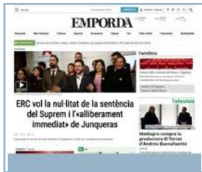
Megabanner flotante 990x90