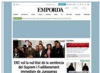
Billboard + Laterales